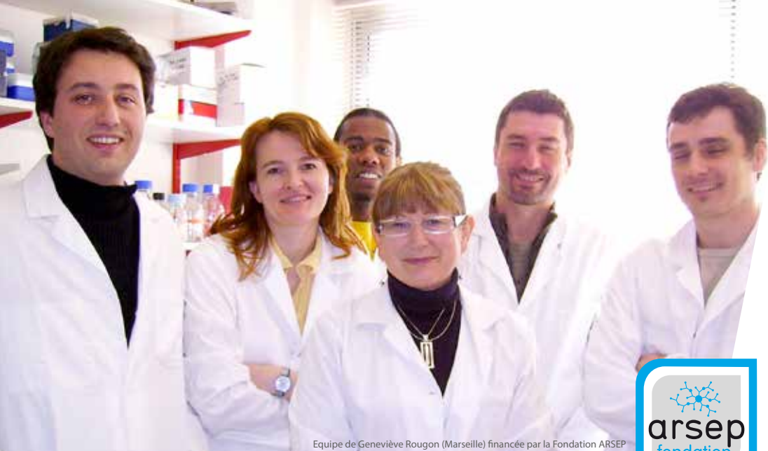
Equipe de Geneviève Rougon (Marseille) financée par la Fondation ARSEP